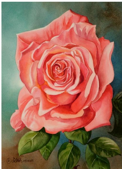
Coralline , aquarelle par Lorraine Dietrich